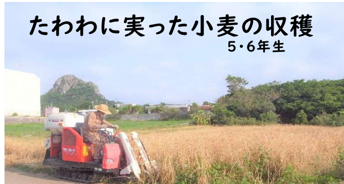
たわわに実った小麦の収穫 5・6年生

ふるさとを学ぼう～地域の素材をいかして～のテーマのもと「伊江っ子ファームプロジェクト」に取り組んでいます。新学期に入り、小麦とらっきょうの収穫時期になりました。本来は児童が作業をする予定でしたが休校中であることと、新型コロナウイルス感染拡大防止の為、当初からご協力いただいている方々のご指導の下、職員で作業を行いました。