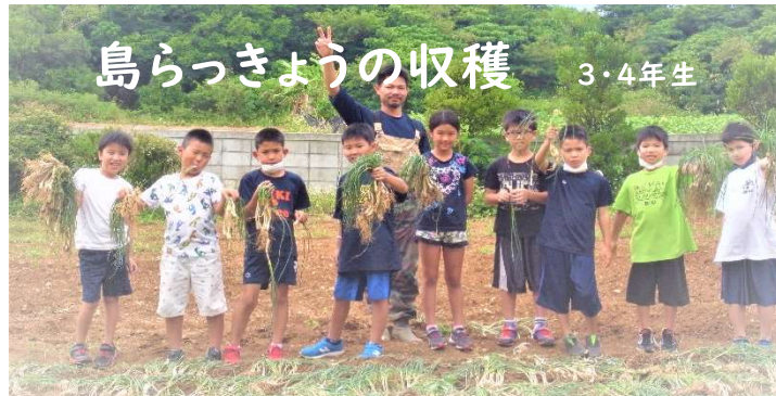
島らっきょうの収穫 3・4年生