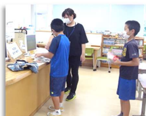
前の人との距離を!