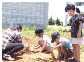
2年生インゲン植え