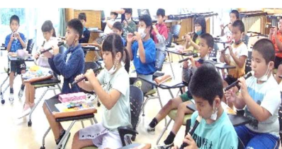
3年生初めてリコーダー♪