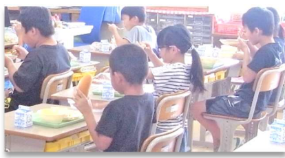
前を向いておしゃべりは無し