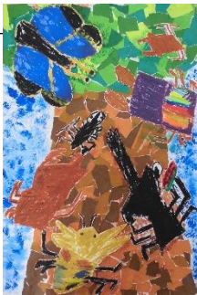
1年生：大城 一瀬 自由図書『むしのもり』