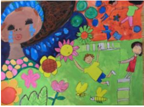
5年生：又吉 結 指定図書『みんなとちがうきみだけど』