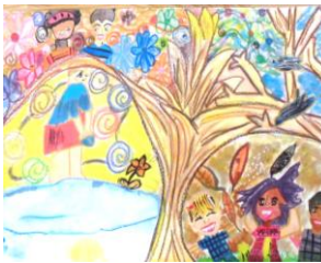
6年生：知念 優生 指定図書『みんなとちがうきみだけど』