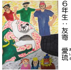
6年生…友寄 愛琉 指定図書『炎の風吹け妖怪大戦』