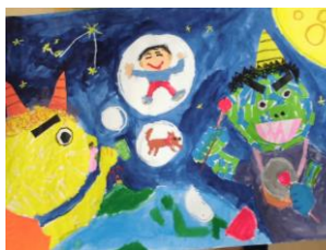
3年生：友寄 輝方 指定図書『きょだいながチャガチャ』