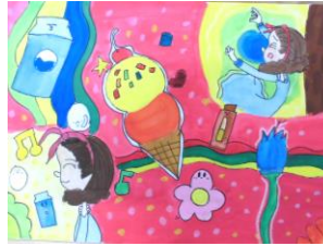
5年生：大城 百愛 自由図書『わかったさんのアイスクリーム』