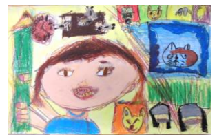
2年生：高良 空良 指定図書『まめまめくん』