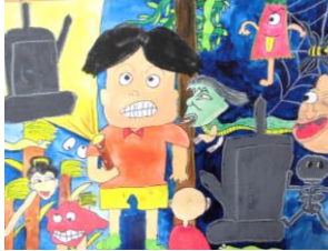
5年生：玉城 橙汰 自由図書『きょうしつはおばけがいっぱい』