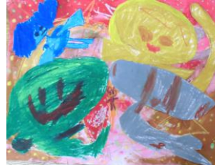
1年生：前津 維波 指定図書『まめまめくん』