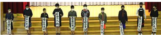
👏 ひまわりさんが一年生の様子を見学しました!

毎年恒例の新春書初め大会が開催されました。1、2年生は各教室で硬筆、3～6年生全員体育館で毛筆を行います。書の基礎基本を講話していただいた後、早速練習です。一人一人の名前入りのお手本を参考に、書いた文字とお手本を見比べながら…。4名の講師の先生方が一人一人に丁寧にアドバイスしていただき、ぐんぐん上達していきました。60分間の練習のあとは作品紹介! 真剣な表情の中にも書を楽しんでいる子どもたちの姿が印象的でした。学校HPでも紹介しています。ご覧ください。