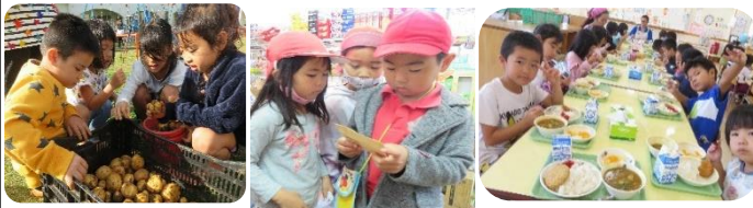
ジャガイモほり ☑ お買い物 ☑ カレー最高!!