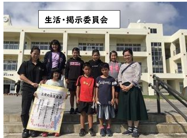
生活・掲示委員会