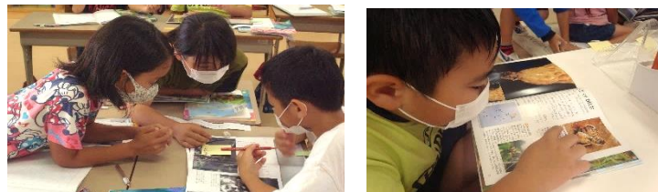
伝えたいことがはっきりと伝わるか、友達と交流して確かめています。

学校ではいろいろな活動がありますが、授業の時間が一番多くなります。新しい知識や技術・技能の習得をはじめとしてお友達と交流を通し学び合い成長するのが授業です。授業は子供たちを指導する教員も成長する場です。「学び」の中心的役割を授業が担っています。本校ではこの授業を磨く取り組みの一環として一人 2 回以上の公開授業を行っています。本年度も教員の授業力向上を目指し、授業改善に取り組みます。授業研究会では、思考する場面での交流の仕組み方について議論しました。