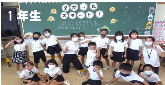
千由希先生と彩夏先生と一緒にがんばるぞ!

ぼくは、うんどうかいのたまれがたのしみです。たくさん たまをいっぱいいれたいです。ずこうがたのしみです。えと こうさくをしたいです。