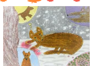
3年生：平田 絆乃 指定図書『花のすきなおかみ』