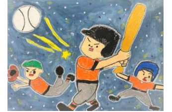
4年生：儀間 栄晃 指定図書『みんな、星のかけらから』