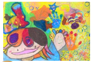
優秀賞 2年生：東江きりり 指定図書『こんにちは！わたしのえ』