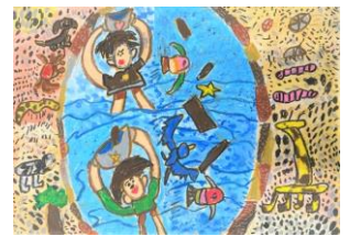
2年生：古堅 白柳汰 自由図書『みずをくむプリンセス』