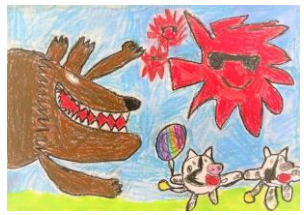
1年生：蔵下 凛 自由図書『まめうしのあついなつ』