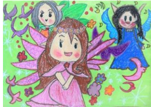
2年生：前津 維波 自由図書『ねむりひめ』