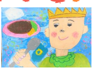
3年生：東江 昂 指定図書『にくのくに』