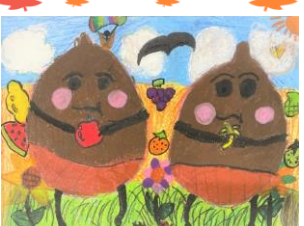
3年生：比嘉 琥珀 自由図書『どんぐりころちゃん』