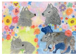
優秀賞 4年生：嶺井 凛 指定図書『花のすきなおかみ』