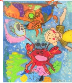
自由図書『うみ100だてのいえ』