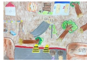
6年生：名渡山 愛梨 自由図書『青い空つながった』