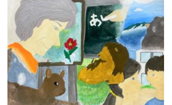
6年生：棚原 妃南 自由図書『百年たったら』