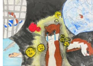
5年生：比嘉 琥羽 自由図書『カワウソの海』