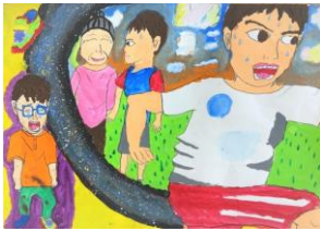
6年生：金城 樹里 指定図書『トップラン』