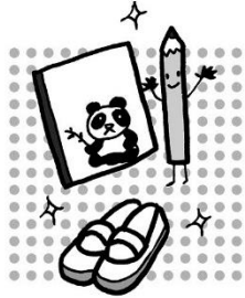
しんがつ き じゆん び 新学期の準備は オツケー OK？