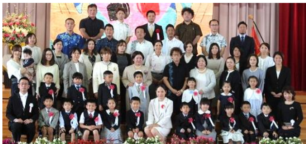
入学式 ぴかぴかの一年生 17名です!