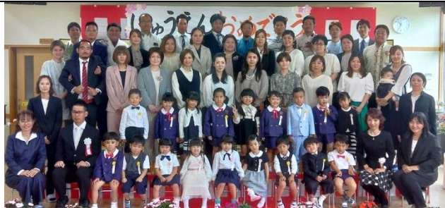
入園式 かわいい幼稚園児 20名です!