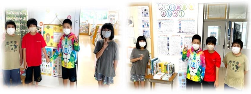
図書委員会活動中! 出入口付近に課題図書・指定図書のコーナーあります。