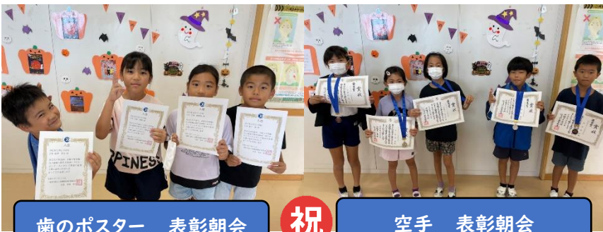
歯のポスター 表彰朝会