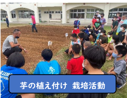
芋の植え付け 栽培活動