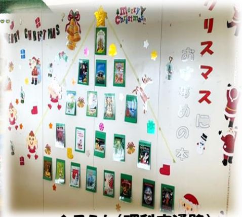
↑ ろうか(理科室通路)