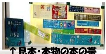
↑見本・本物の本の帯

本の帯は、読者に向けてタイトルだけではわからない本の魅力・売り文句となるキャッチコピーを伝える役割を果たしています☆