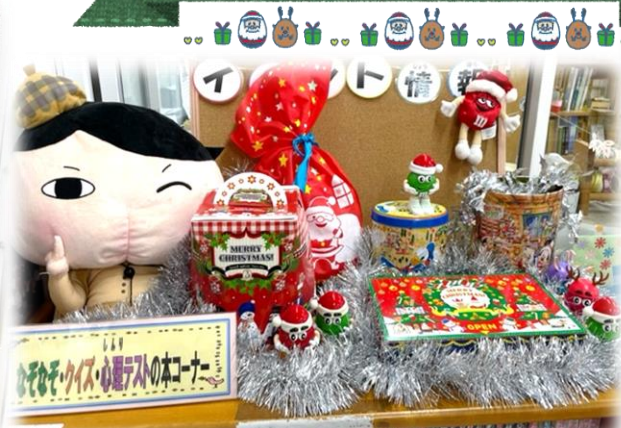
↑ なぞなぞ・クイズ・心理テストコーナー